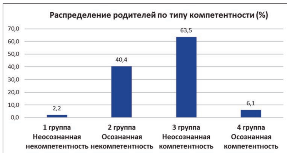
Рисунок 3. Общее количество родителей с разными типами компетентности