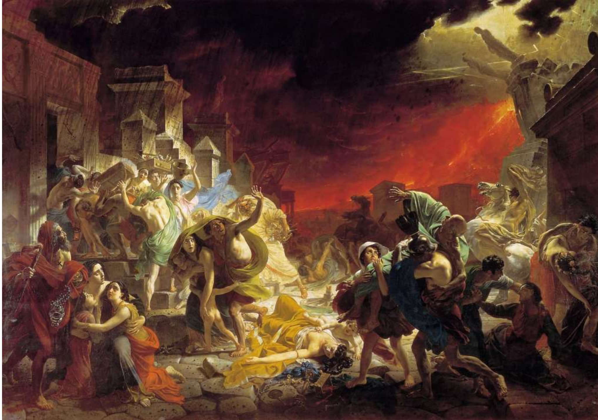
Карл Брюллов «Последний день Помпеи»